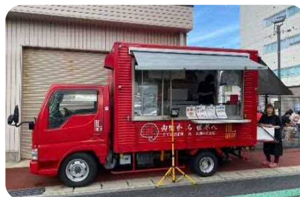
軽食喫茶モグモグ