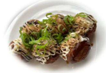
ビールのお供に！ 揚げたこ 500円