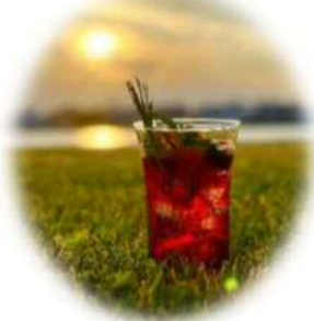
オリジナルカクテル レイク アンド サンセット 700円