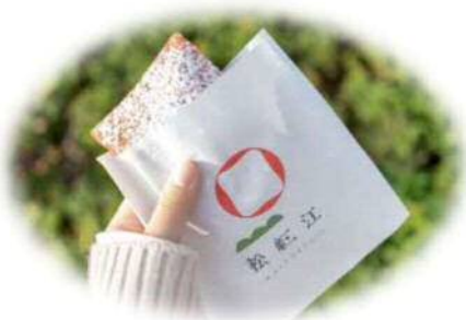
松江の新名物？ 松紅江 300円