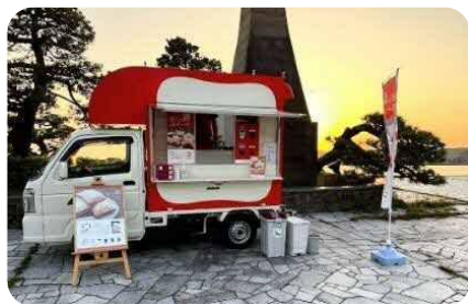
たなべたたらのもり