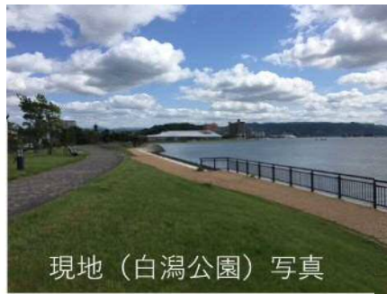
現地（白潟公園）写真