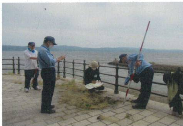
西浜佐陀環境護岸【宍道湖】での点検状況