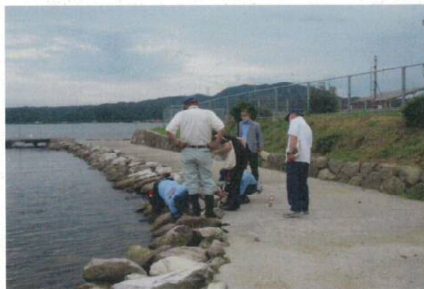
本庄水辺の楽校【中海】での点検状況

なお、捨石の隙間などを19箇所を確認しましたが、これらについては、必要に応じて、適切に対策を実施します。