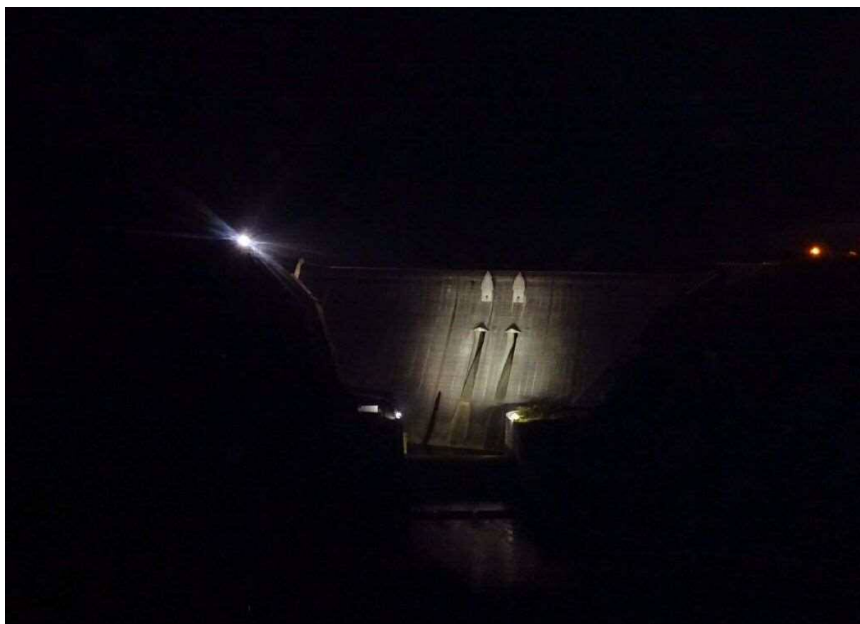
志津見ダム ライトアップの状況(令和3年11月)