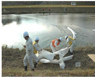
<国土交通省班によるオイルフェンス展張>

【水質事故訓練実施状況（飯梨川）】 ※近年においては、令和元年度に飯梨川（富田橋上流）で、水質事故対策訓練の実施