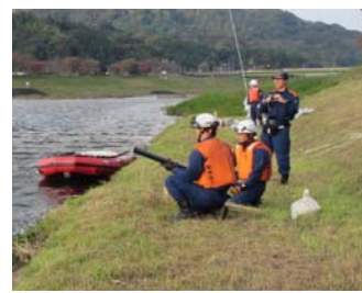
<救命索発射銃によるオイルフェンス展張>

斐伊川水系水質汚濁防止連絡協議会は、国土交通省中国地方整備局出雲河川事務所、鳥取・島根両県、流域市町や関係機関で組織し、斐伊川水系の水質保全の取り組みや水質事故の抑止・処理対策などの活動を行っています。