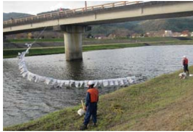
<安来市班によるオイルフェンス展張>