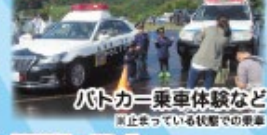
パトカー乗車体験など ※止まっている状態での乗車