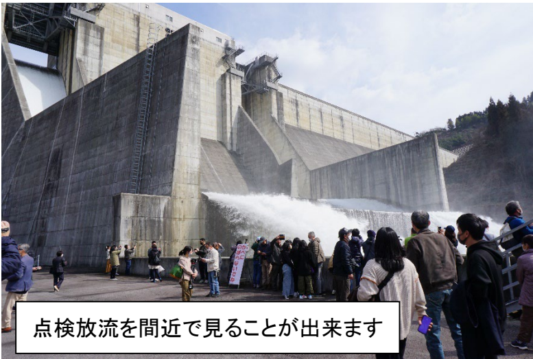
点検放流を間近で見ることが出来ます