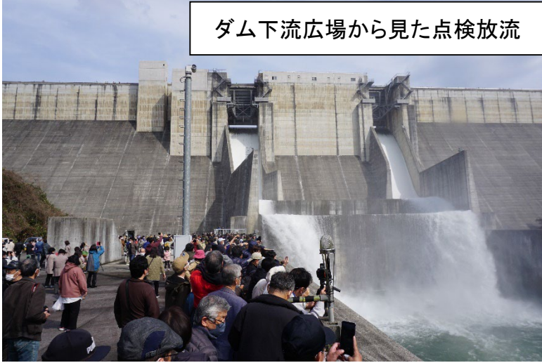
ダム下流広場から見た点検放流