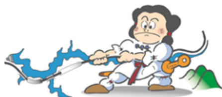
志津見ダムキャラクター「くにびきくん」