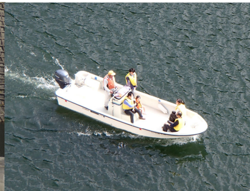
巡視艇体験の様子

■フラワーバレー会場では、パネル展示(志津見ダム・大橋川改修事業)、降雨体験機による降雨体験等を行っています。