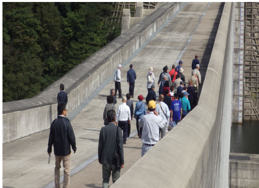
ダム見学会の様子