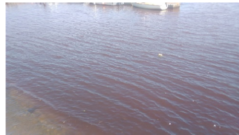
赤潮状況写真 (米子湾)