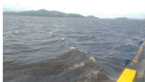
赤潮状況写真(米子湾)