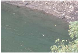
権現大橋から角井方向に筋状 (長さ 9m 幅 2m程度)に発生 (レベル2)