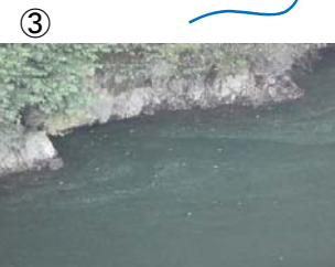
③ 権現大橋から角井方向に筋状 (長さ 9m 幅 3m程度) に発生 (レベル2)