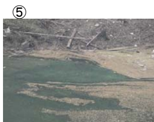
⑤ 権現大橋から角井方向に筋状 (長さ 3m 幅 1.5m程度) に発生 (レベル2)