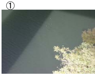
① 戸井谷大橋から左岸に筋状 (長さ 5m 幅 2.5m程度) に発生 (レベル2)