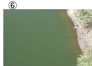
⑥ 貝谷大橋から上流に筋状 (長さ 6m 幅 1.5m程度) に発生 (レベル2)