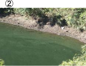
② 権現大橋から角井方向に筋状 (長さ 6m 幅 2.5m程度) に発生 (レベル2)