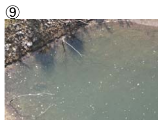
⑨ 貝谷大橋から上流に筋状(長さ 1m 幅 3m程度)に発生 (レベル2)