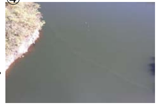
④ 権現大橋から下流 右岸に筋状(長さ 1m 幅 10m程度)に発生 (レベル2)