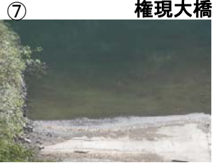
⑦ 権現大橋から角井方向に筋状(長さ 3m 幅 5m程度)に発生 (レベル2)