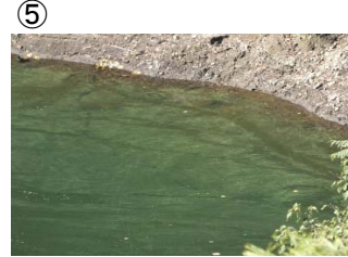
⑤ 権現大橋から角井方向に筋状(長さ 5m 幅 10m程度)に発生 (レベル2)