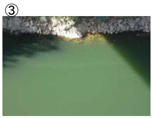
③ 戸井谷大橋から左岸に筋状(長さ 1m 幅 3m程度)に発生 (レベル2)