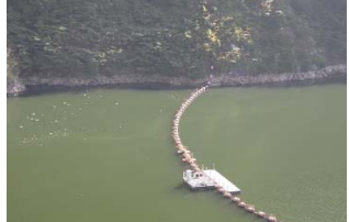
① 網場付近に筋状(長さ 1.5m 幅 9m程度)に発生 (レベル2)