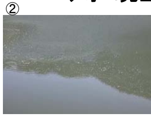
② 艇庫付近に筋状(長さ 1.5m 幅 6m程度)に発生 (レベル2)