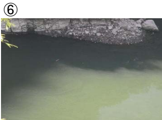
⑥ 権現大橋から角井方向に筋状(長さ 1.5m 幅 6m程度)に発生 (レベル2)