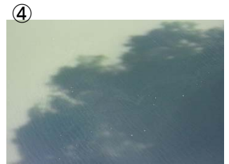
権現大橋から下流 右岸に筋状(長さ 2m 幅 5m程度)に発生 (レベル2)