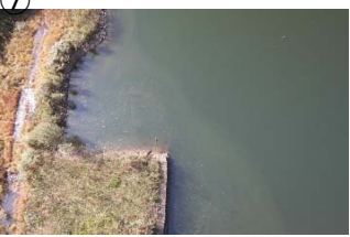
貝谷大橋から上流に筋状(長さ 5m 幅 10m程度)に発生 (レベル2)