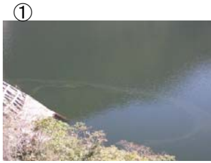
堰堤上流付近に筋状(長さ 1.5m 幅 10m程度)に発生 (レベル2)