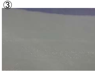
戸井谷大橋から左岸 艇庫付近対岸に筋状(長さ 1.5m 幅 5m程度)に発生 (レベル2)