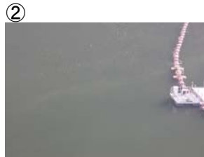
② 網場付近に筋状(長さ10m 幅 2m程度)に発生 (レベル2)