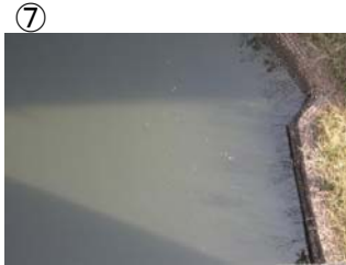
⑦ 貝谷大橋から下流に筋状(長さ 5m 幅 2m程度)に発生 (レベル2)