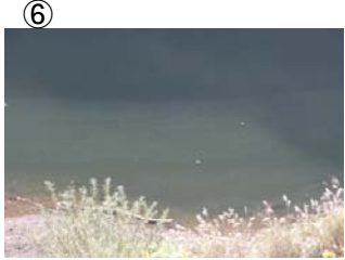
⑥ 権現大橋から角井方向に筋状(長さ 5m 幅 9m程度)に発生 (レベル2)