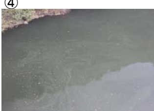
④ 権現大橋から角井方向に筋状(長さ 15m 幅 15m程度)に発生 (レベル2)