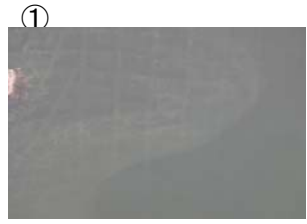
① 堰堤上流付近に筋状(長さ10m 幅 5m程度)に発生 (レベル2)