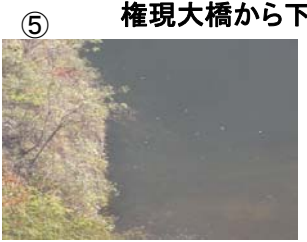
⑤ 権現大橋から角井方向に筋状(長さ 5m 幅 3m程度)に発生 (レベル2)