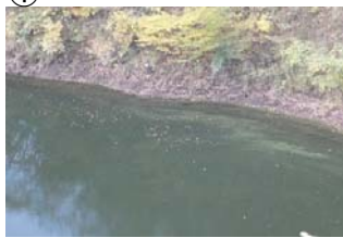
① 権現大橋から角井方向に筋状(長さ 10m 幅 3m程度)に発生 (レベル2)