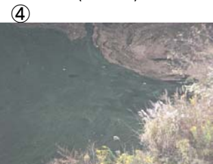
④ 権現大橋から角井方向に筋状(長さ 6m 幅 1.5m程度)に発生 (レベル2)