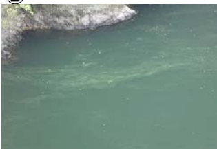
② 権現大橋から角井方向に筋状(長さ 10m 幅 5m程度)に発生 (レベル2)