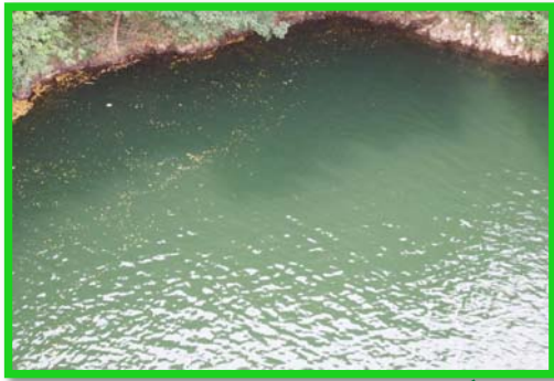
レベル2 5m × 15m程度