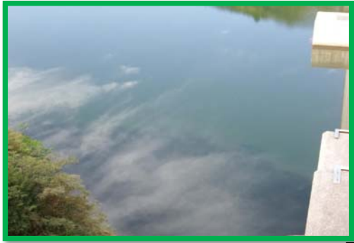
レベル2 2m × 10m程度