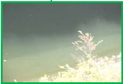
レベル2 2m × 15m程度