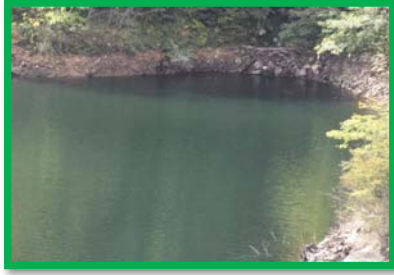
レベル2 2m × 10m程度