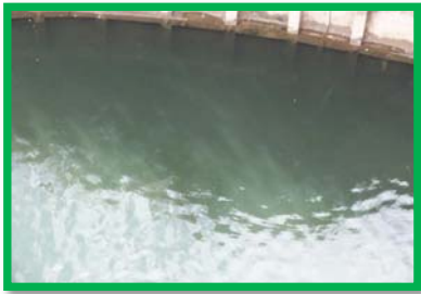
レベル2 5m × 5m程度