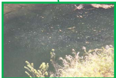
レベル2 2m × 3m程度