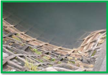
レベル2 2m × 6m程度