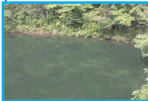
貝谷大橋から上流