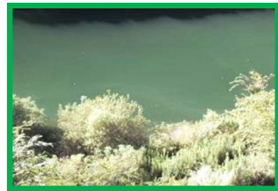
レベル2 5.0m × 20.0m程度