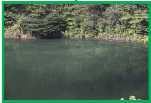
レベル2 1.5m × 10.0m程度

志津見ダム堤体 堤体上流付近 網場付近 戸井谷大橋 艇庫付近 戸井谷大橋から左岸 下山トンネル 戸井谷大橋から上流 権現大橋から下流 権現大橋 権現大橋から上流 大蔵(上)水門 角井川 貝谷大橋から下流 貝谷大橋 貝谷大橋から上流 至 三瓶山・観原