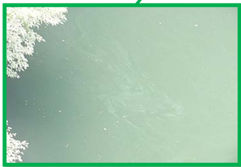
レベル2 3.0m × 5.0m程度