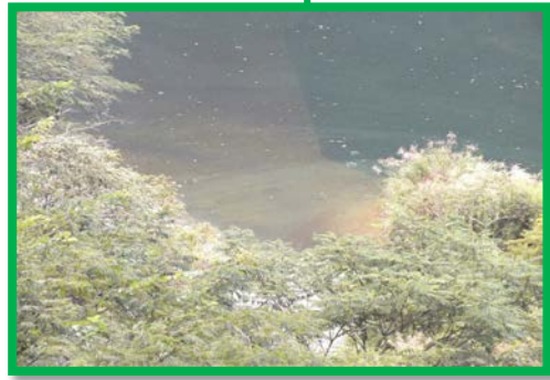
レベル2 2.0m × 10.0m程度