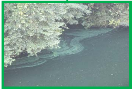
レベル2 2.0m × 30.0m程度