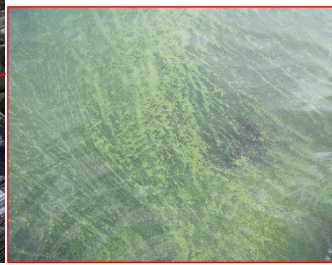
宍道湖南岸(松江市宍道町)