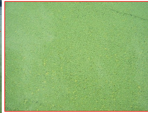
宍道湖南岸(松江市玉湯町)