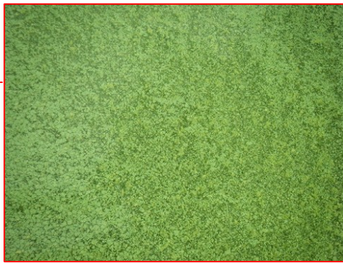
宍道湖南岸(松江市玉湯町)