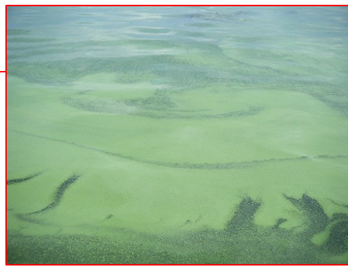
宍道湖南岸(松江市宍道町)