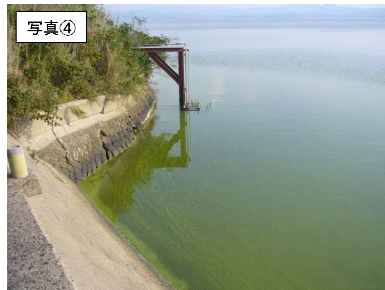
宍道湖北岸(出雲市)