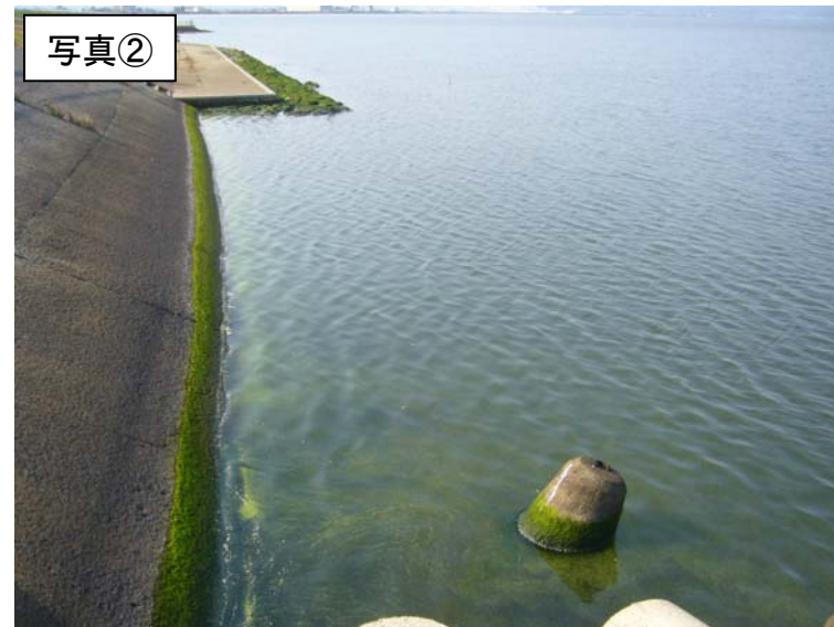
宍道湖西岸(出雲空港付近)