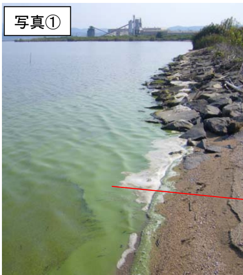
宍道湖西岸(斐川町)