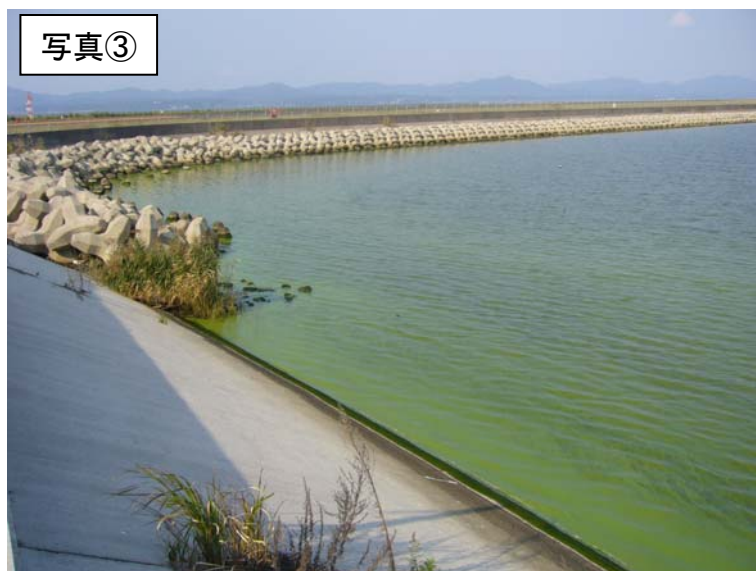
宍道湖西岸(出雲空港付近)