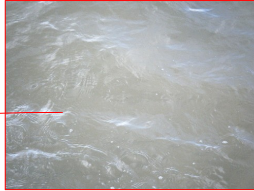
宍道湖北岸(松江市浜佐陀町)