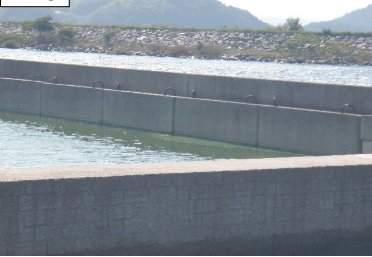
中海右岸(米子市彦名町)