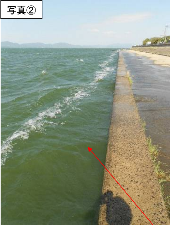
宍道湖南岸(松江市宍道町宍道)