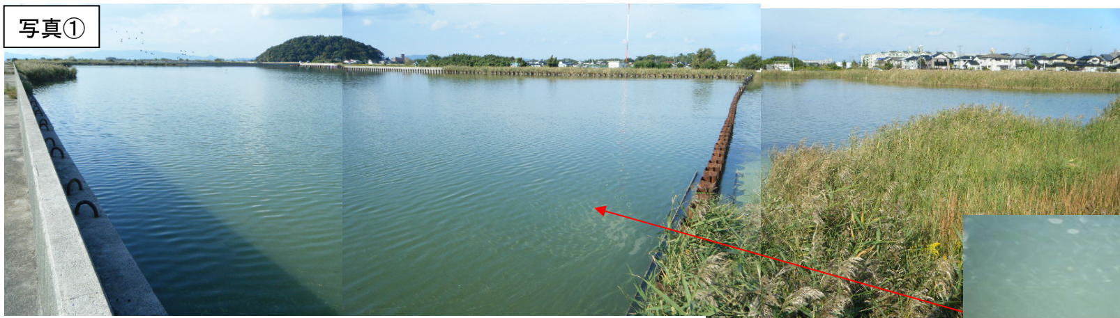
彦名 Pond 内