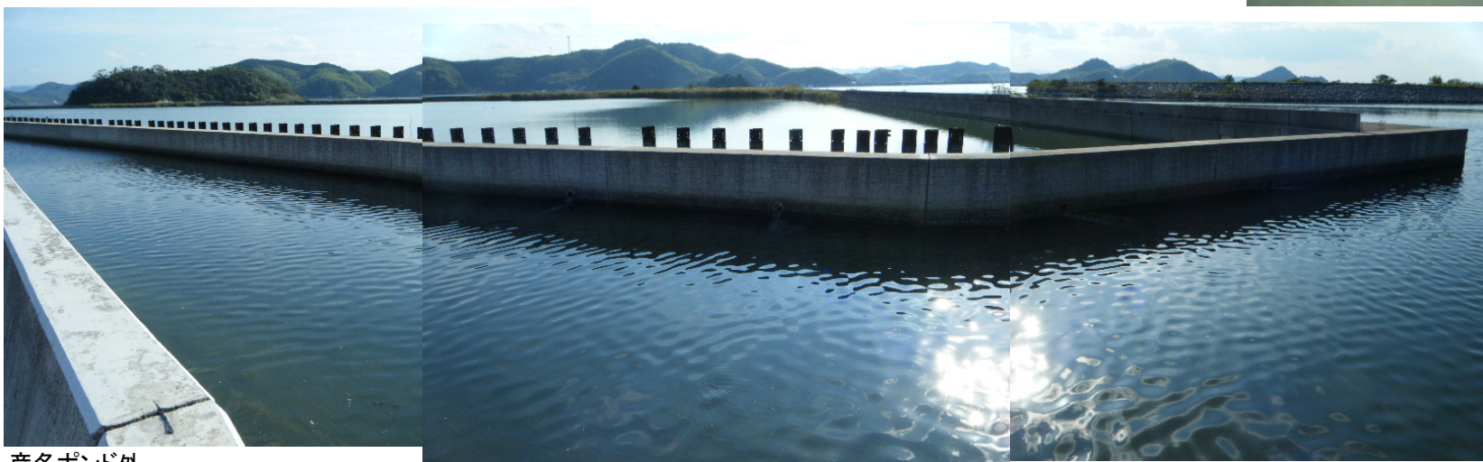
彦名 Pond 外