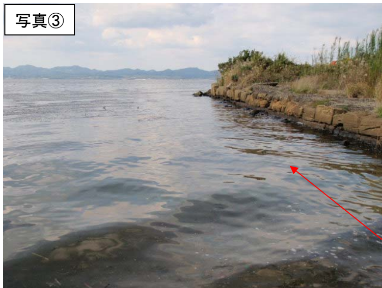
央道湖南岸(松江市玉湯町西来待)