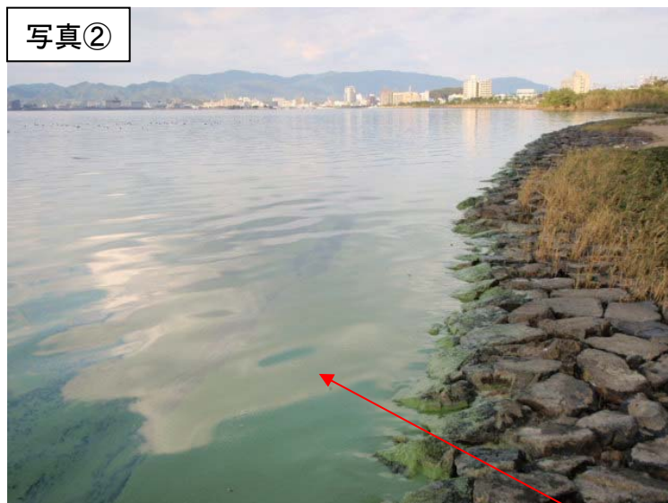
央道湖南岸(松江市玉湯町布志名)