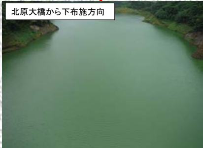
北原大橋から下布施方向