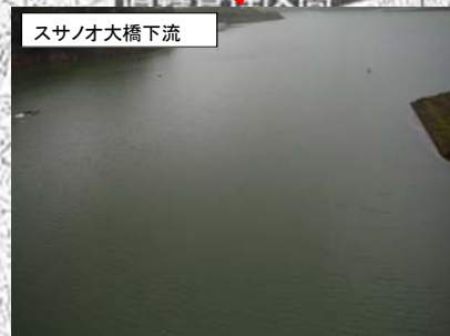
スサノオ大橋下流