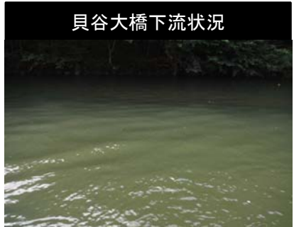
貝谷大橋下流状況