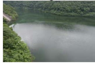
② 艇庫付近からダム湖流心部にアオコが帯状(長さ20m・幅3m程度)に発生。(レベル2) 艇庫付近全体では、レベル1。