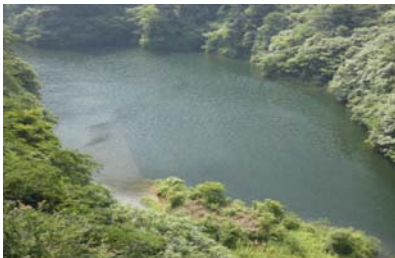
角井川上流部 右岸側に帯状(長さ5m幅2m程度)に発生。(レベル2) 角井川上流から権現大橋の範囲では、レベル1。