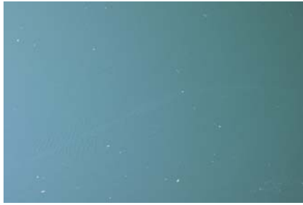
堤体上流部 うすく筋状(長さ7m幅0.5m程度)に発生。(レベル2)