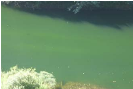
権現大橋上流部 うすく筋状(長さ10m幅1.0m程度)に発生。(レベル2)