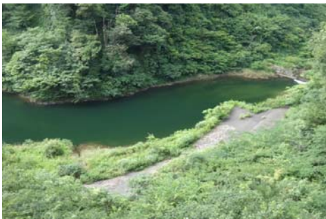
権現大橋上流部 面状(長さ5m幅3m程度)に発生。(レベル2)