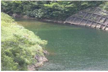
堰堤上流付近 右岸側 带状(長さ3m 幅1m程度)に発生。(レベル2)