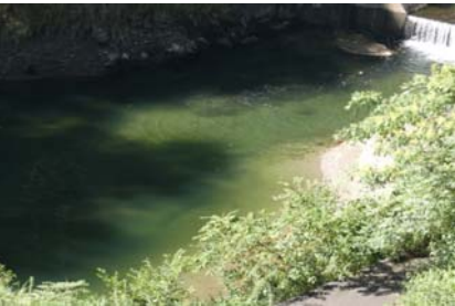
権現大橋上流部 带状(長さ7m幅3m程度)に発生。(レベル2)