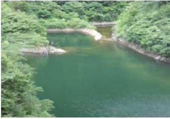
戸井谷大橋 左岸側 黄状(長さ5m幅3m程度)に発生。(レベル2)