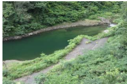
権現大橋上流部 带状(長さ7m幅3m程度)に発生。(レベル2)