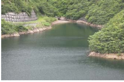
堰堤上流付近 右岸側 带状(長さ3m幅2m程度)に発生。(レベル2)