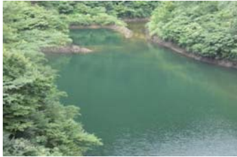
戸井谷大橋 左岸側 帯状(長さ2m幅2m程度)に発生。(レベル2)