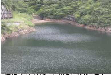
堰堤上流付近 右岸側 帯状(長さ5m 幅2m程度)に発生。(レベル2)