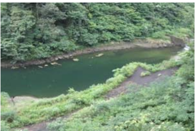
権現大橋上流部 帯状(長さ7m幅3m程度)に発生。(レベル2)