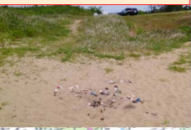
バーベキューのゴミの投棄