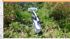
エアロバイクの投棄