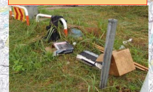
ビデオデッキ等の投棄