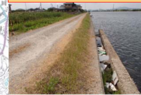
発砲スチロール等の投棄