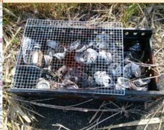
バーベキューのゴミの投棄