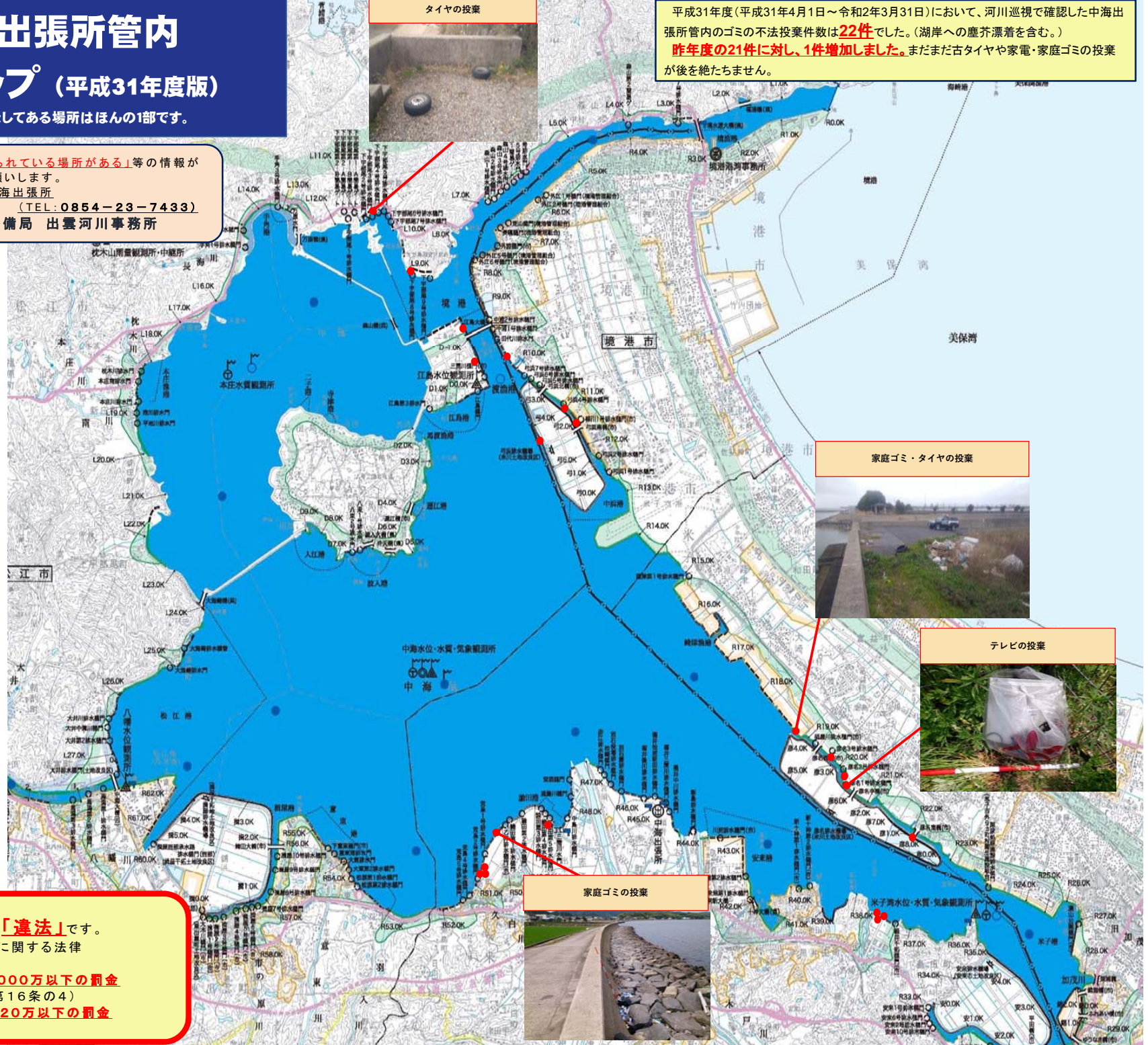
家庭ゴミ・タイヤの投棄

平成31年度(平成31年4月1日～令和2年3月31日)において、河川巡視で確認した中海出張所管内のゴミの不法投棄件数は 22件 でした。(湖岸への塵芥漂着を含む。) 昨年度の21件に対し、1件増加しました。 まだまだ古タイヤや家電・家庭ゴミの投棄が後を絶たません。