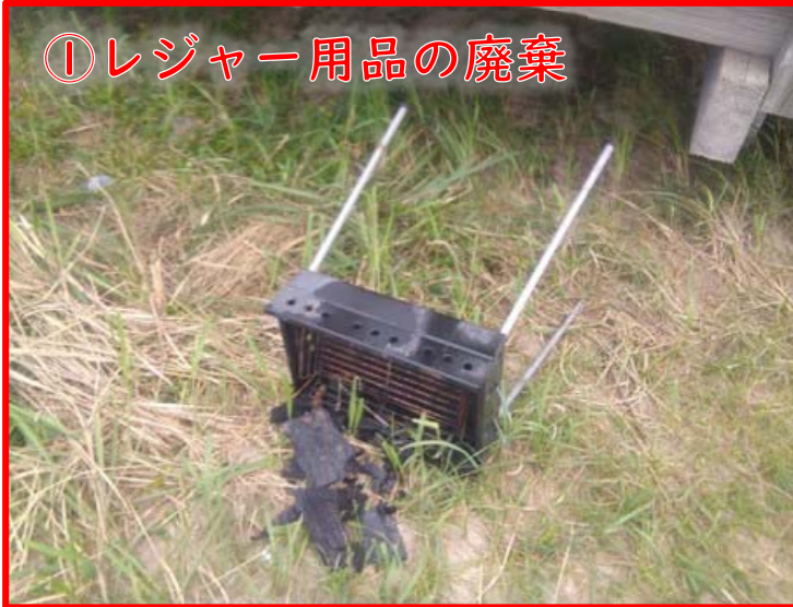
① レジャー用品の廃棄