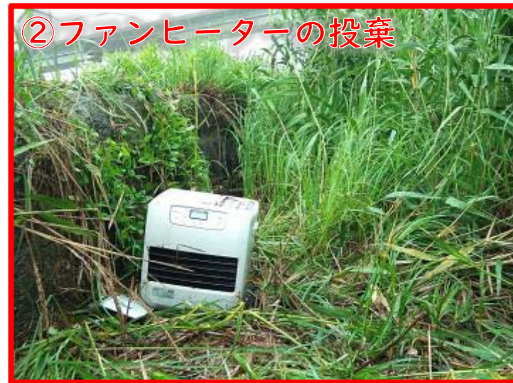
②ファンヒーターの投棄