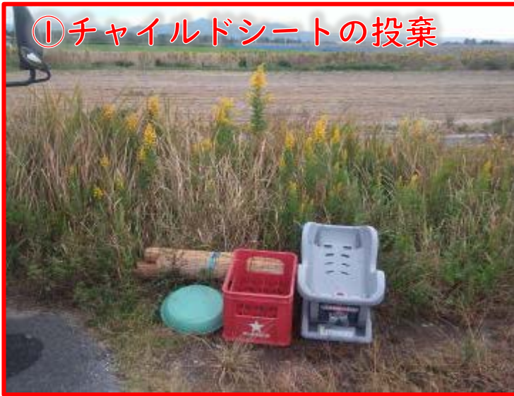
①チャイルドシートの投棄