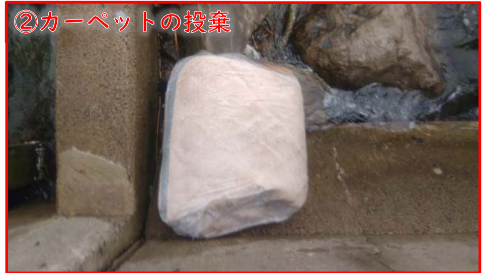
②カーペットの投棄