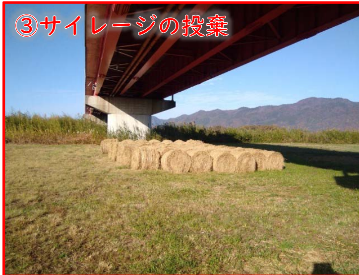
③サイレーズの投棄