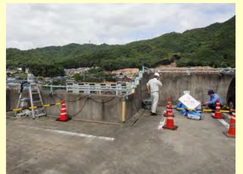
仮設カメラ設置状況 (広島市安佐南区)