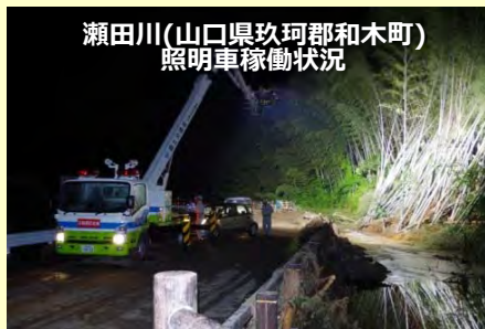
瀬田川(山口県玖珂郡和木町) 照明車稼働状況