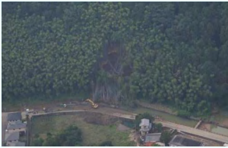
瀬田川 河道閉塞箇所

8月6日下関気象台は山口県に記録的短時間大雨情報を発表。岩国観測所〔山口県岩国市〕の1時間雨量（71ミリ）、大竹観測所〔広島県大竹市〕の1時間雨量（68ミリ）の観測史上最大を記録し、一般国道2号（岩国市）では路面冠水・土砂流出による通行止め、小瀬川水系瀬田川（山口県玖珂郡和木町）では河道閉塞による浸水被害などが発生した。