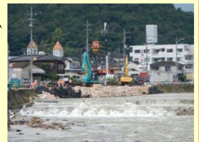
広島市安佐北区 護岸復旧作業状況