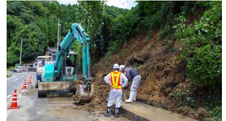
国道2号土砂撤去作業（岩国市）

8月6日の山口豪雨では岩国市、和木町などにおいて、土砂流出による通行止め、浸水被害が発生し、排水ポンプ車による排水作業、夜間作業に伴う照明車運用、国道の土砂撤去作業・路面清掃作業による早期の交通開放を実現するなど応急対策、応急復旧に大きく貢献した。