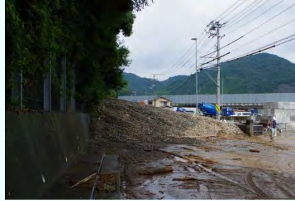
一般国道2号 土砂流出箇所