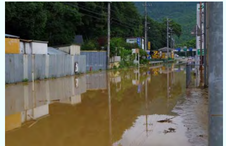
一般国道2号 道路冠水箇所