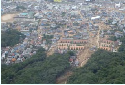
広島市安佐南区 土石流箇所

8月20日、広島気象台は広島県に土砂災害警戒情報及び記録的短時間大雨情報を発表。三入観測所〔広島市〕では1時間雨量（101ミリ）、3時間雨量（217.5ミリ）、24時間雨量（257ミリ）のいずれも観測史上最大を記録し、広島市安佐南区、広島市安佐北区では大規模な土石流が発生、太田川水系根谷川（広島市安佐北区）では護岸崩落や溢水による浸水被害などが発生した。