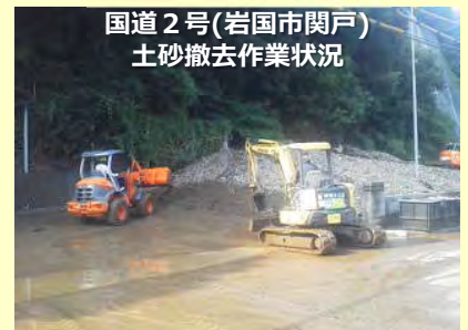
国道2号(岩国市関戸) 土砂撤去作業状況