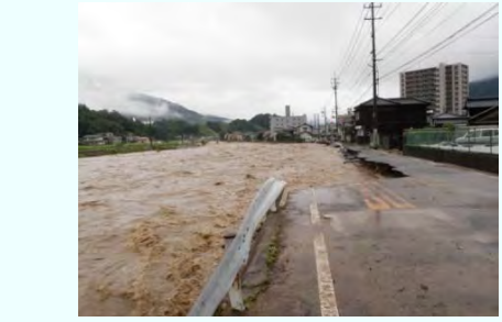
根谷川（広島市安佐北区）護岸崩落箇所