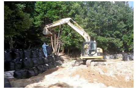
大型土のう設置作業（広島市安佐北区）

また、8月20日の広島豪雨では、大規模な土石流の発生による道路・河川・住宅地への土砂流出、河川の護岸崩落や溢水による浸水が発生したが、排水ポンプ車による排水作業、夜間作業に伴う照明車運用、土石流の土砂撤去、渓流への大型土のう設置、緊急法面点検、対策工法の検討等の実施により、応急対策、応急復旧に大きく貢献した。