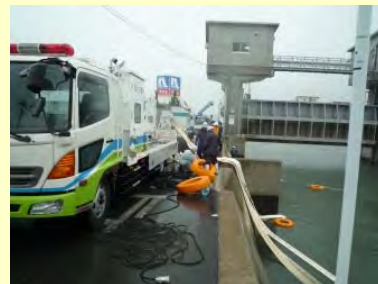
羽原川(福山市)排水ポンプ車設置状況