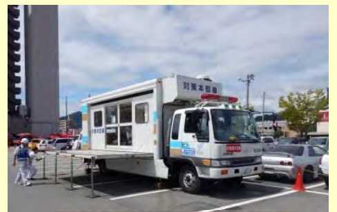
現地対策本部 (広島市安佐南区)