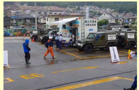
現地対策本部 (広島市安佐南区)