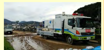
広島市安佐南区 排水ポンプ車稼働状況