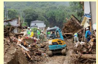
広島市安佐南区 土砂撤去作業状況

アマノ企業(株)、大津建設(株)、(株)大歳組、大之木建設(株)、大林道路(株) 中国支店、大林道路(株) 中国支店 備前営業所、大政建設工業(株)、(株)ガイアート・T・K 中国支店、鹿島道路(株) 中四国支店、(株)加藤組、河井建設工業(株)、(有)木下組、(株)京栄建設、(株)楠建、栗栖建設工業(株)、(株)栗本、(株)鴻治組、広成建設(株)、山陽工業(株)、(株)砂原組、世紀東急工業(株) 中国支店、世紀東急工業(株) 中国支店 岡山営業所、大成ロテック(株) 中四国支社、(株)高山、(株)竹下建設、(株)田村建設、東亜道路工業(株) 中国支社、常盤工業(株) 広島支店、戸田道路(株) 広島支店、錦建設(株)、日特建設(株) 広島支店、(株)NIPPO 中国支店、日本道路(株) 中国支店、沼田建設(株)、(株)ノバック 広島支店、肥海建設(株)、広電建設(株)、福田道路(株) 中国支店、フジタ道路(株) 広島支店、(株)伏光組、前田道路(株) 中国支店、(株)増岡組、松尾建設(株) 広島支店、(株)水口組、宮川興業(株)、宮田建設(株) 広島支店、洋伸建設(株)、ライト工業(株) 中国支店、ワールド建設(株)