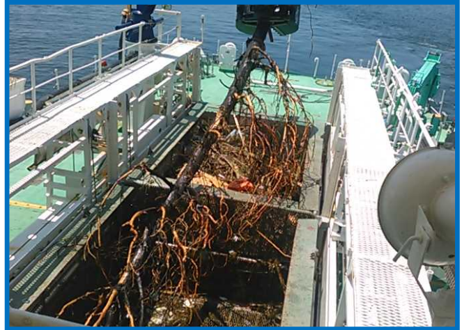
8/5:「おんど 2000」による漂流物の回収状況（蒲刈港沖合）