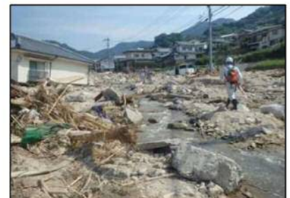
総頭川下流の河道を埋塞する大量の土砂