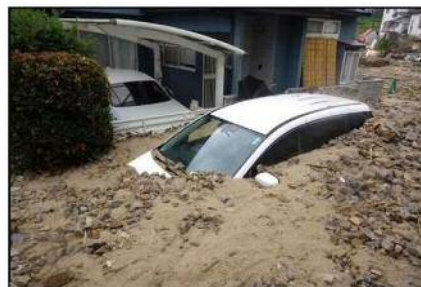
土石流により甚大な被害の発生した大谷川(東区馬木)の状況