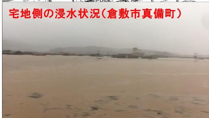
宅地側の浸水状況(倉敷市真備町)