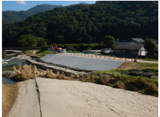
緊急対策工事完成時