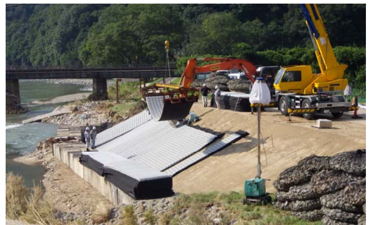
ブロックマット据付状況