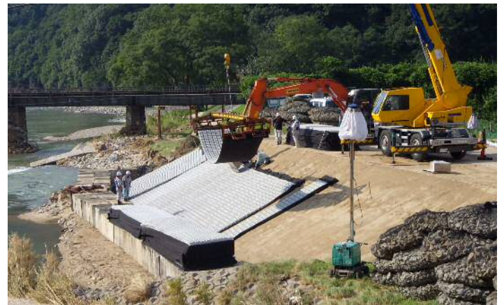
ブロックマット据付状況