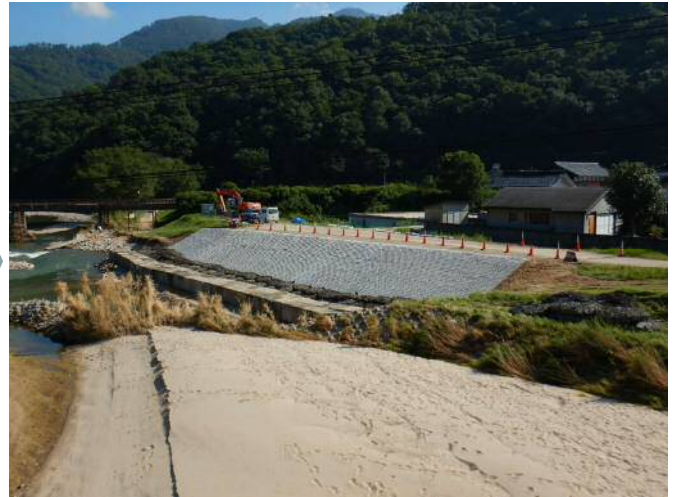
緊急対策工事完成時