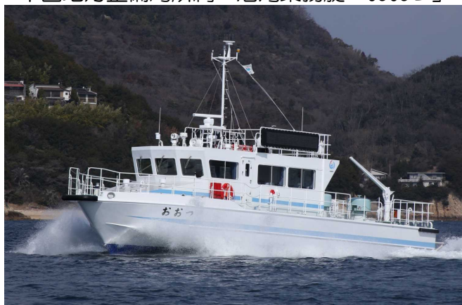
中国地方整備局所属 港湾業務艇「おおつ」