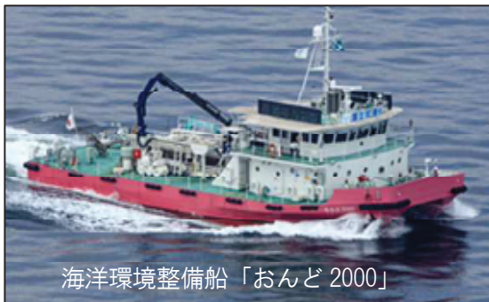
海洋環境整備船「おんど2000」

7月5日から8日にかけて、西日本に降り続いた記録的な豪雨により、広島港から呉港にかけて確認された、流木などの漂流物を海洋環境整備船「おんど2000」（中国地方整備局所属）、「クリーンはりま」（近畿地方整備局所属）で回収作業を行っています。