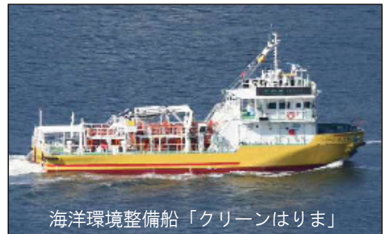
海洋環境整備船「クリーンはりま」